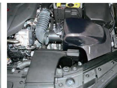
15. カーボンケースを車両にステアを調整しながら配置します。ゴムブッシュがしっかり車両側の凸部に刺さっている事を確認してください。