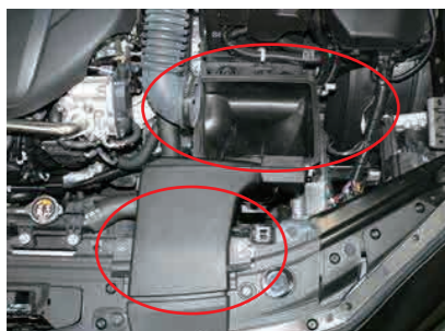
4. フレッシュエアダクトとエアークリーナーケースを一体で取外します。