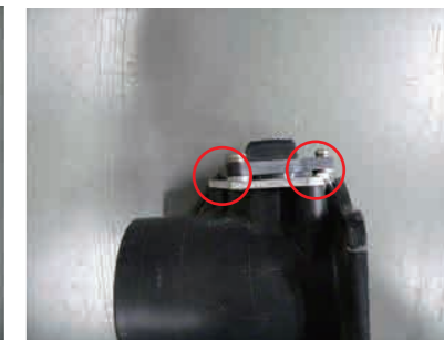
9. エアフローアダプターにワッシャーを挟みビスBx2でエアフローセンサーを取付けます。