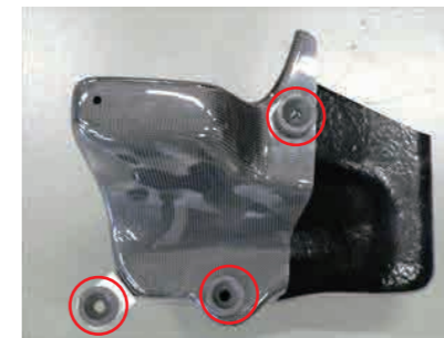
11. カーボンケースとステアに取外したゴムブッシュを取り付けます。