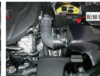
18. エアフローセンサーコネクタを差し込みエアフローセンサーの配線留めをカーボンケースに取付けます。