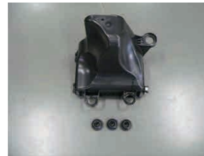
7. エアークリーナーケースからゴムブッシュを3か所取外します。