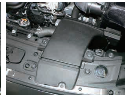
17. フレッシュエアダクトを取外したボルトで固定します。