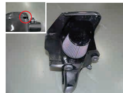
13. ファンネルアダプターにエアフィルターを取付けます。ケース横のサービスホールでバンドを締めつけ固定します。