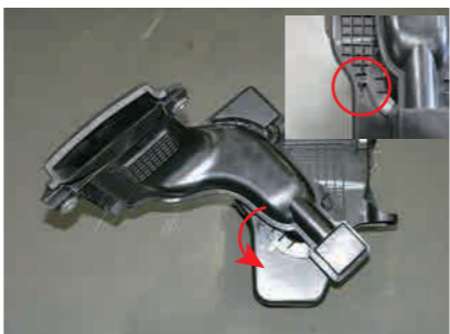
6. エアークリーナーケースからフレッシュエアダクトを取外します。