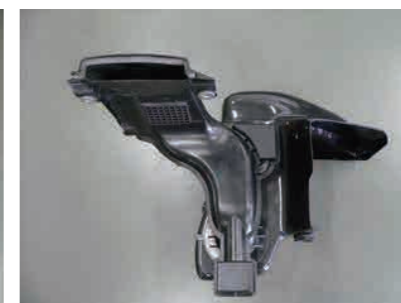
14. フレッシュエアガイドをカーボンケースに取付けます。