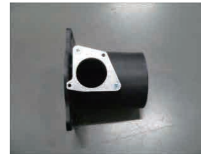
8. ビスCx2を使用して、エアフローアダプターに変換プレートを取付けます。