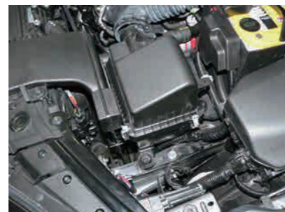
2. エアークリーナーカバーをエアホースから外し、エアークリーナーエレメントを取外します。