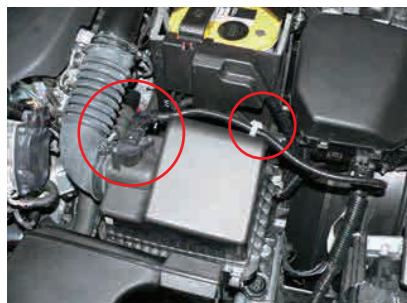
1. エアフローセンサーコネクタとエアフローセンサーの配線留めを外します。エアホースクランプを緩めます

注) ボルト及びナットは緩み防止のため、必ずネジロック剤等を塗付して取付けてください。