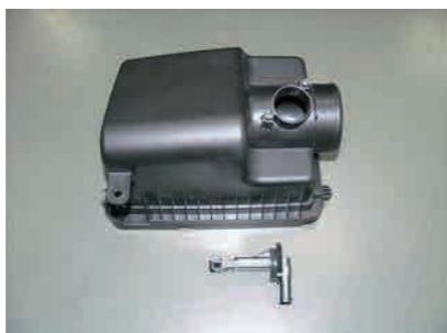
5. エアークリーナーカバーからエアフローセンサーを取外します。