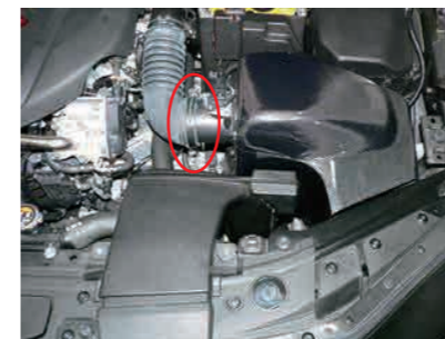
16. エアホースをエアフローアダプターに差し込みホースクランプを締めこみます。