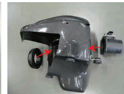
12. ファンネルアダプターとエアフローアダプターをカーボンケースを挟み込むようにビス Ax4 で固定します。