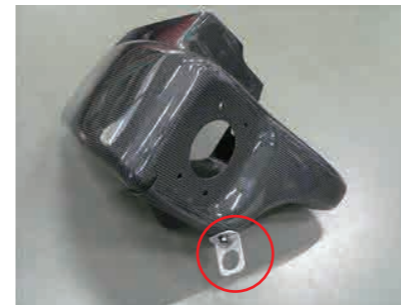
10. カーボンケースにビス Ax1 を使用してステアを取付けます。ステアの向きは写真を参考にしてください。